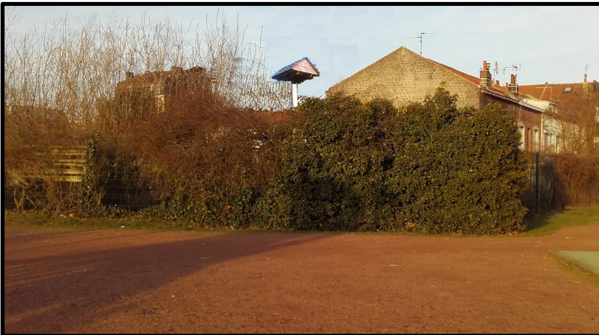
Simulation du projet – vue depuis l'aire de jeux de la Plaine des Métallurgistes