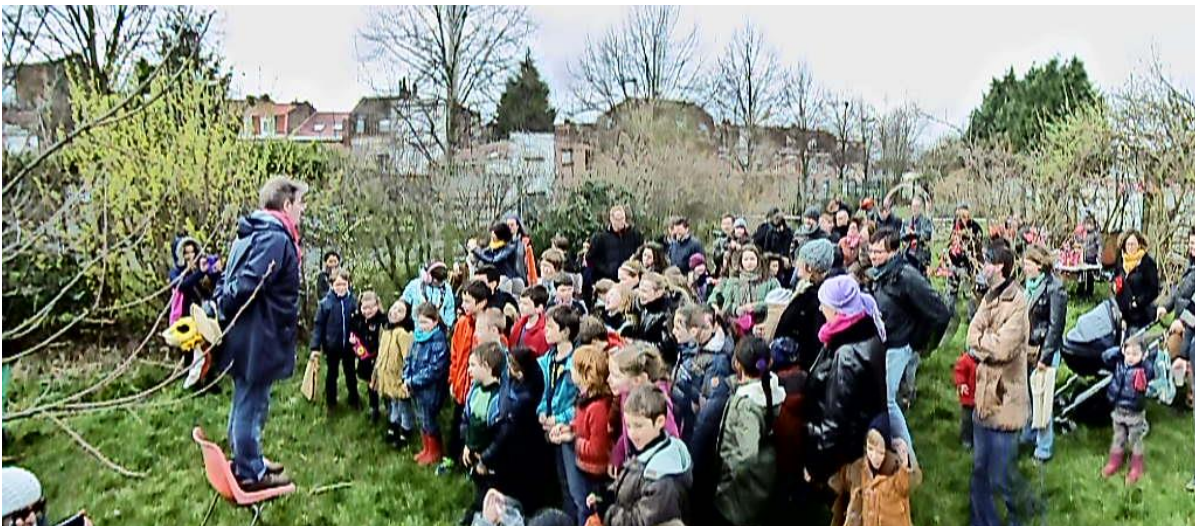
Chasse aux œufs 2018

Le Bizardin est prêt pour cette nouvelle aventure collective et naturelle.